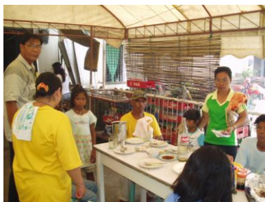
Lunch i Cantilan

Senare bar det iväg på motorcyklar den långa vägen till Cantilan. Där skulle vi till skräddare för att ta mått till skoluniformerna, köpa in skolmaterial, mjölk, ris, mediciner, vitaminer och mycket, mycket mer. Dagen blev lång och vi stannade på marknadsplatsen för att äta ris och kyckling tillsammans. Alla var ganska trötta när dagen tog slut och en jeepney, en Filippinsktillverkad bil, kunde köra folk (oss) och inköpen tillbaka. Dagen efter återstod det bara att korrigera listorna och göra inköpen för mjölk, pulvermjölk, och en rissäck till var familj.