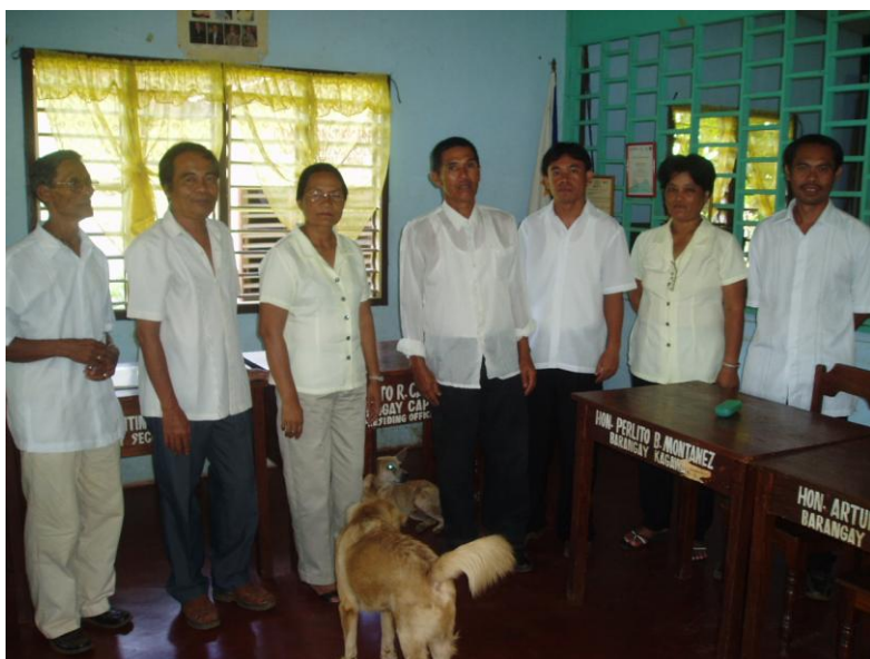
Byn Adlay's byråd s.k. Barangay Council 2009

FTMS hoppas att ni ser vikten av det arbete som görs världen över bland de fattiga och varför det är viktigt att även de lär sig vilka rättigheter de har. Det är då de slutar att strida men kan vara en del av uppbyggandet av det egna landet. En vision som redan "den förste Filippinern", José Rizal, hade i slutet av 1800-talet.